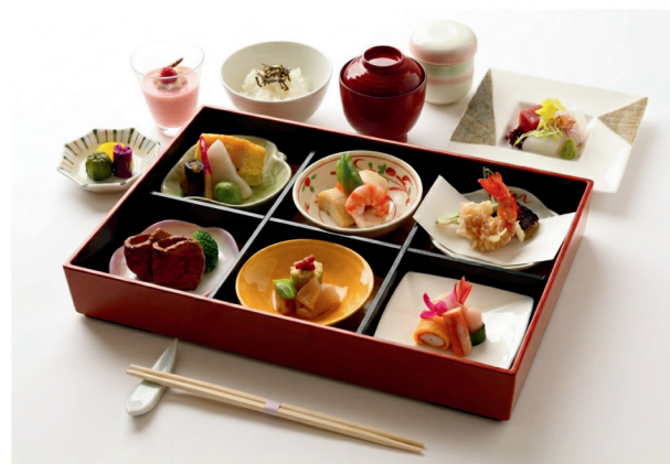
懐石 雪洞〈ほんぼり〉