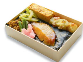
海苔弁銀鱈西京焼き