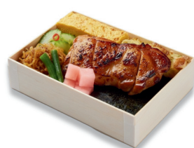
海苔弁鶏照り焼き