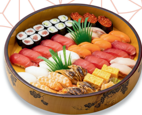
上にぎり寿司〈5人盛り〉