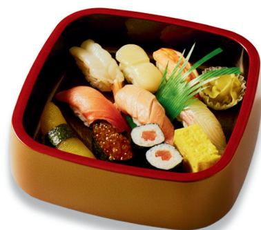
特上にぎり寿司〈1人盛り〉