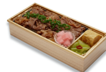
十勝ハーフ牛焼肉弁当