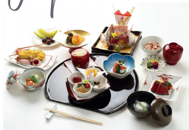
懐石 浦安〈うらやす〉