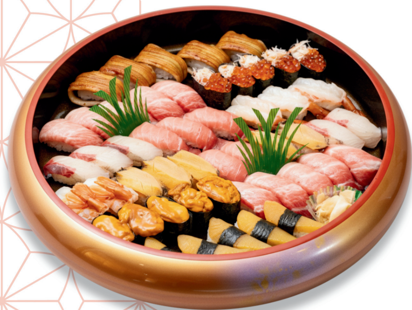
特選にぎり寿司〈5人盛り〉