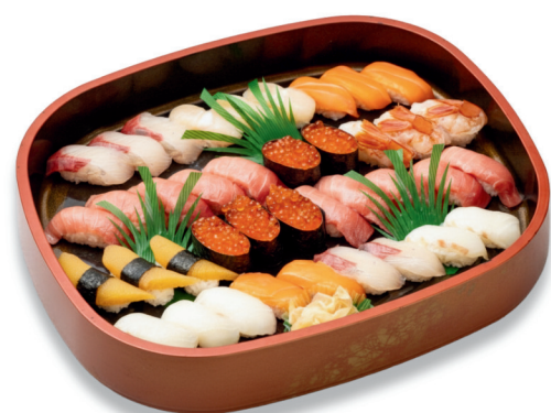
特上にぎり寿司〈5人盛り〉