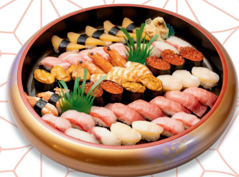
特々上にぎり寿司〈5人盛り〉